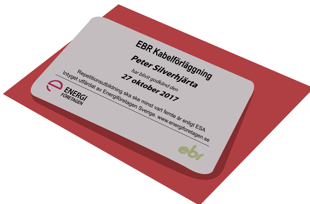
Bild 2. Exempel på utbildningsbevis.

Personer som utför arbeten med kabelförläggning ska ha genomgått utbildning och tillgjort sig kunskap enligt gällande dokument, Krav vid kabelförläggning. Denna kunskap ska kunna styrkas med EBR utbildningsintyg från utbildningen EBR Kabelförläggning.