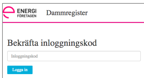
Figur 6 Engångskod för inloggning