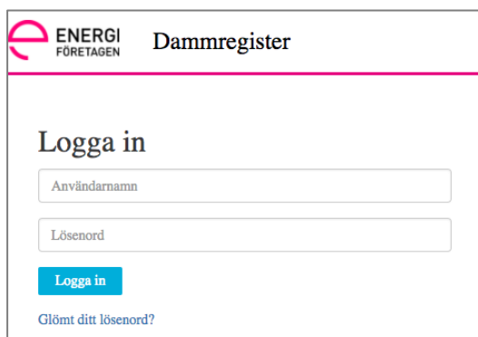
Figur 5 Inloggningsvyn till Dammregistret