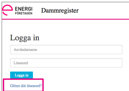
Figur 12 Länk för glömt lösenord till Dammregistret