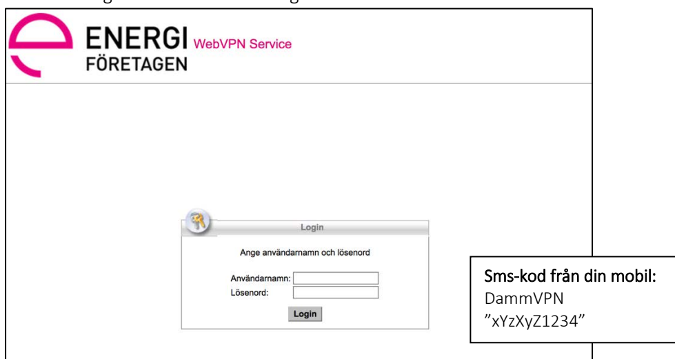
Figur 7 Inloggning till VPN-portalen