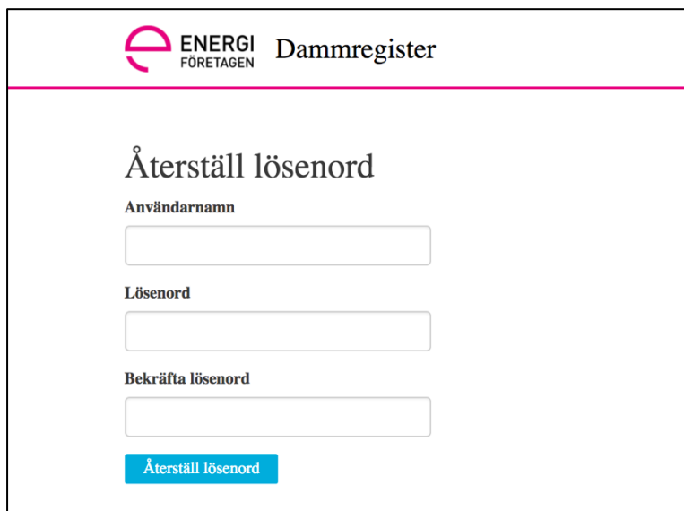
Figur 3 Aktivera/återställ lösenord till Dammregistret