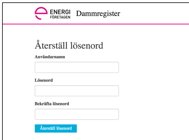
Figur 13 Vy för att återställa lösenord