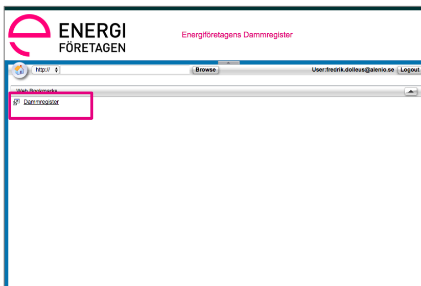
Figur 8 VPN-portalen med länk till Dammregistret